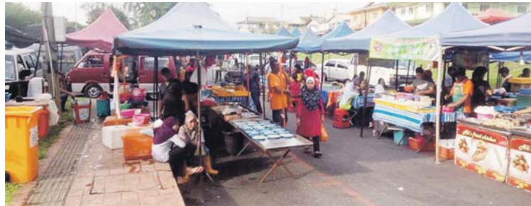
Kawasan tapak pasar pagi dan pasar malam di Taman Medan.

itu bukannya perkara baharu kerana sebelum ini ibu bapanya pernah berdepan situasi sama di pasar itu.