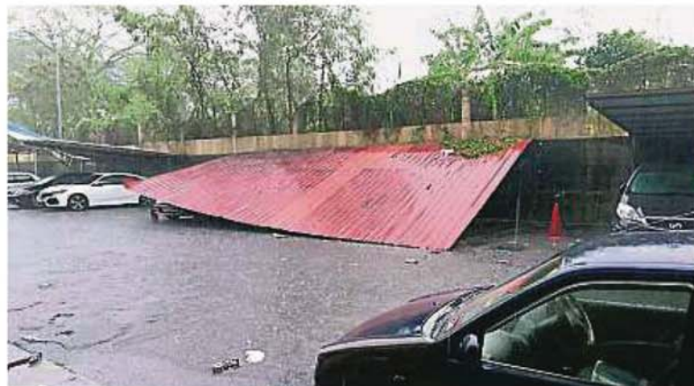
强风吹到停车场遮雨棚，多辆轿车恐受波及。

消防局发言人说，班底消防局人员则于晚上6时40分受召到马来亚大学校园第6考试楼清理倒树，5分钟后敦依斯迈医生花园消防局也接到树倒投报，派员前往到武吉加拉路，并