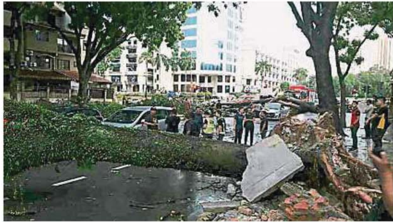
消防人员和警方在树倒现场进行勘查和清理工作。