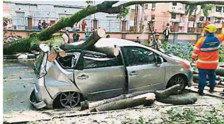
半毀。 一輛轿车被倒樹击中，車身