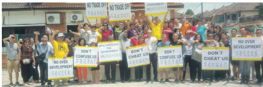
Penduduk taman perumahan di sekitar Bandar Sungai Long yang membantah cadangan pindaan guna tanah.