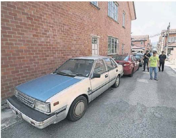
■ 单单是一条小巷就有3辆废车平排在旁。