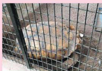
迷你动物园内有刺蝟、孔雀、巨龟等。