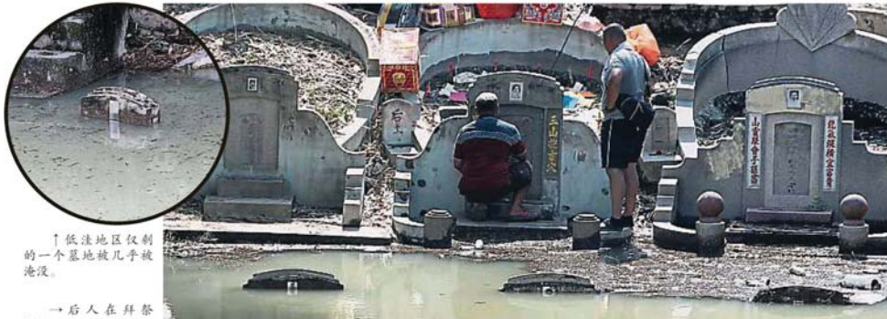
↑低洼地区仅制的一个墓地被几乎被淹没。

Provided for client's internal research purposes only. May not be further copied, distributed, sold or published in any form without the prior consent of the copyright owner.