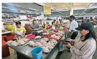
放眼望去，生鸡档的档主都是华裔，由于价格公道，小贩和助手待客亲切友善，因此多年来吸引各种族消费群体光顾。