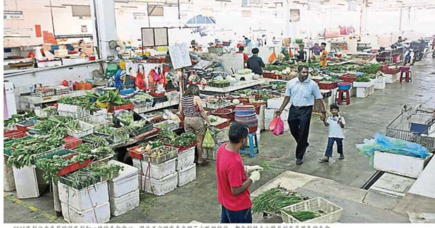
SS15巴剎分为底层的湿巴剎和一楼的美食中心，因此不少顾客在光顾了小贩档后，都会到楼上一饱小酌及享用各种美食。