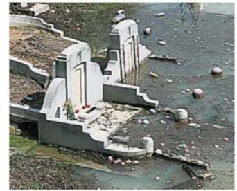
许多发糕漂浮在水上。