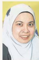
诺菲查：若市议会拒绝申请，将会给予业者时间拆迁。