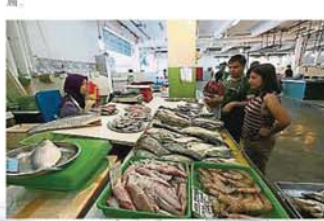
海产品的小贩多半是马来同胞，即便是人潮不多的工作日，他们也如常摆摊，以满足不同顾客群的需求。