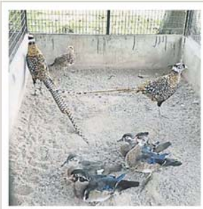
色泽缤纷多彩的禽鸟，最为吸引人。