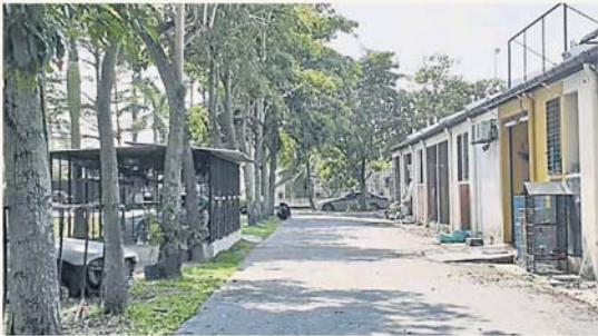
“迷你动物园”最大问题是霸占公园保留地，而违反地方法令。