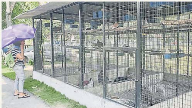
据悉，傍晚时段会吸引不少人前来“迷你动物”观赏动物。

尽管报道后，有网民维护业者“分享”心善意，不过，其占用公共保留地，实际已违反地方政府法令，若要合法化，则视乎得到当地居民的认可及其卫生环境是否带来隐性的威胁。