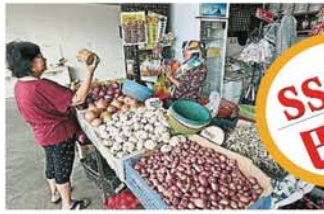
虽然巴剎杂货档的小贩以华裔同胞居多，但华裔及印裔妇女都爱光顾，充分体现出三大种族一家亲的和睦精神。