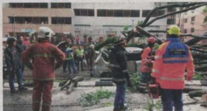
ANGGOTA APM dan bomba memotong dahan pokok yang menghempap sebuah kereta di Bandar Sri Permaisuri, Kuala Lumpur.

"Beberapa anggota pasukan APM telah dikerahkan