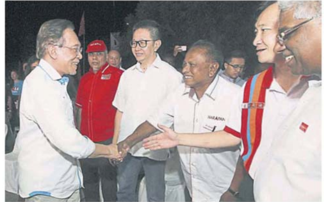
安华一抵步, 即受到希盟其他成员的欢迎。右二起谢琪清、斯特南及邓章钦。

“内阁只有 5 名华裔部长, 伊党却说大马由‘华裔掌权’, 波德申国会议员拿督斯里安华是未来首相接班人, 一定会照顾森州的未来发展。”