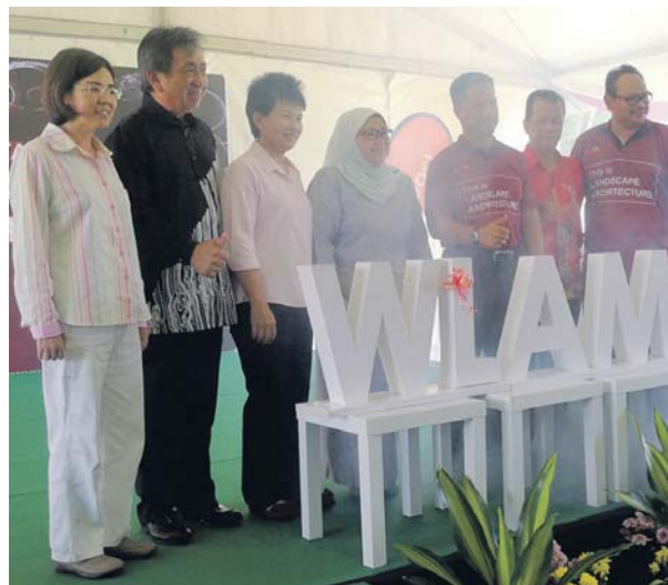
Rotina (tengah) menyempurnakan perasmian sambutan WLAM Peringkat Daerah Hulu Selangor di Taman Awam Jenjarum.

“Penganjuran ini dapat meningkatkan kesedaran membudayakan landskap merangkumi seni bina dalaman dan luaran persekitaran mereka,” katanya ketika merasmikan Ekspo WLAM 2019 Peringkat Daerah Hulu Selangor, ke-lmarin.