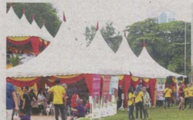
The one-day carnival held at Dataran PJ saw a host of government agencies and NGOs set up booths to promote healthy living.