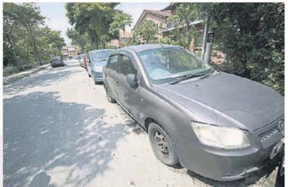
■ 多辆废弃的轿车除了霸占泊车位和影响市容，也可能成为蚊虫滋生的温床。