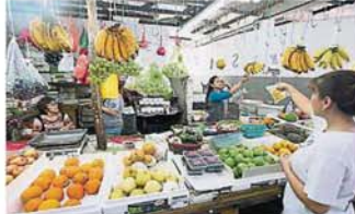
水果档售卖的水果应有尽有，除了一般的香蕉、橙和苹果之外，你也可以找到从外国进口的葡萄。