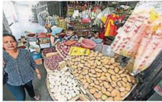
这个杂货档“麻雀虽小，五脏俱全”，各式各样的杂货和麻米油蛋都可以在这里买到。