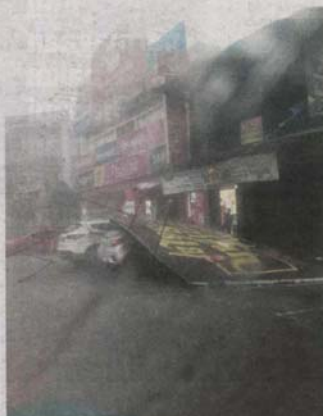
PAPAN tanda sebuah premis yang tumbang akibat dibadai ribut di Bandar Baru Bangi semalam.

KAJANG - Beberapa buah rumah dan kenderaan orang awam rosak akibat dihempap pokok yang tumbang akibat hujan lebat serta ribut petir di beberapa kawasan di daerah ini petang semalam.