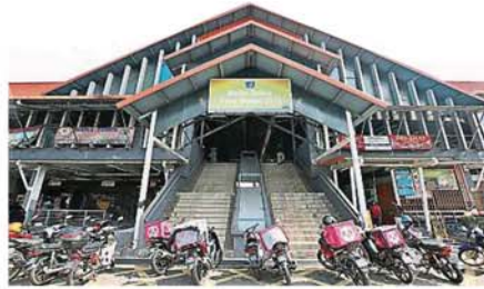
首都市SS15双层式巴剎建筑物外观宏伟，各种款硬体设备一应俱全，惟在受到周遭商业圈带来的生态冲击下，小贩生意不如以往，只是在周六日比较多人潮。

走入巴剎内，你可以发觉它其实是旺中带静的一座公市，共建两层楼，一楼是美食中心，二楼是干和湿巴剎。