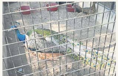
城市小孩或会对孔雀之类禽鸟感兴趣。