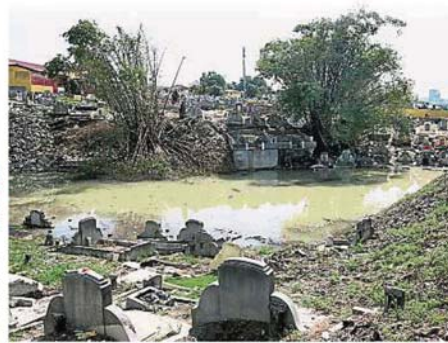
八打灵再也华人义山的低洼地区因排水不及而形成“水池”后，引起民众哗然！