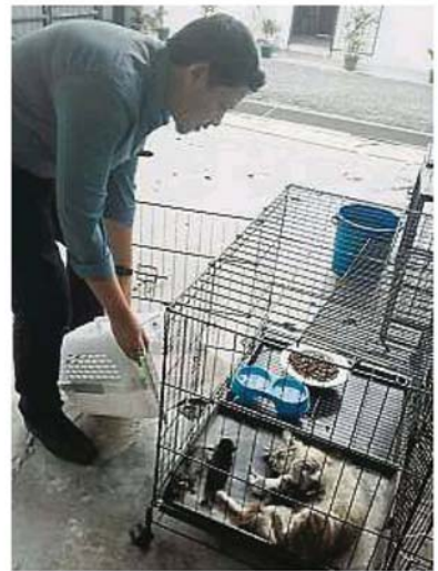
市议会职员领养母猫和幼猫，让牠们不分离。